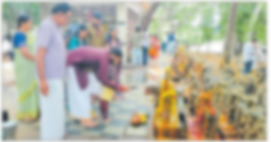
ದೇವಾಲಯದ ಘಟಕ ದಂಡು

ಮೈಸೂರು-ಬೆಂಗಳೂರು ರಸ್ತೆ ಬೆಂಗಳೂರಿನಿಂದ ಮೈಸೂರಿನ ಕಡೆಗೆ ಸಂಚರಿಸುತ್ತಿರುವ ಉತ್ತರ ಕರ್ನಾಟಕ ರಸ್ತೆ ಸಂಸ್ಥೆಯ ಬಸ್ಸುಗಳು ಸುಗಮವಾಗಿ ಸಂಚರಿಸುತ್ತಿವೆ. ರಸ್ತೆ ಸುಗಮವಾಗಿರುವುದರಿಂದ ಪ್ರಯಾಣಿಕರು ಸಂತೋಷಪಟ್ಟು ಸಂಚರಿಸುತ್ತಿದ್ದಾರೆ. ರಸ್ತೆ ಸುಗಮವಾಗಿರುವುದರಿಂದ ಪ್ರಯಾಣಿಕರು ಸಂತೋಷಪಟ್ಟು ಸಂಚರಿಸುತ್ತಿದ್ದಾರೆ.