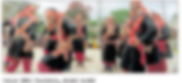
ದೇವಾಲಯದ ಘಟಕ ದಂಡು