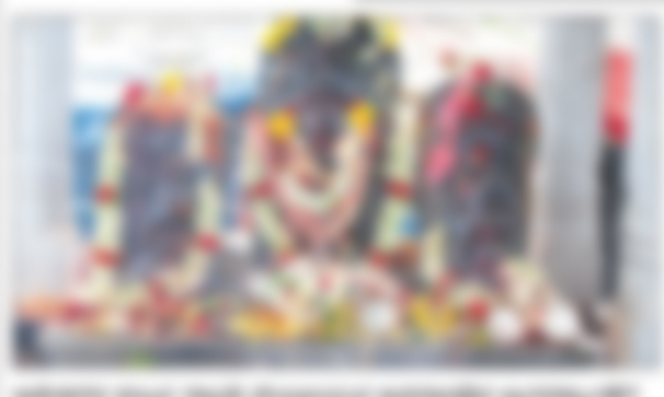
ದೇವಾಲಯದ ಘಟಕ ದಂಡು

ದೇವಾಲಯದ ಘಟಕ ದಂಡು ದೇವಾಲಯದ ಘಟಕ ದಂಡು ಸುಗಮವಾಗಿ ಸಂಚರಿಸುತ್ತಿದೆ. ದೇವಾಲಯದ ಘಟಕ ದಂಡು ಸುಗಮವಾಗಿ ಸಂಚರಿಸುತ್ತಿದೆ. ದೇವಾಲಯದ ಘಟಕ ದಂಡು ಸುಗಮವಾಗಿ ಸಂಚರಿಸುತ್ತಿದೆ.