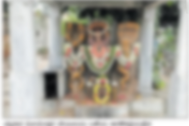
ದೇವಾಲಯದ ಘಟಕ ದಂಡು

ಮೈಸೂರು-ಬೆಂಗಳೂರು ರಸ್ತೆ ಬೆಂಗಳೂರಿನಿಂದ ಮೈಸೂರಿನ ಕಡೆಗೆ ಸಂಚರಿಸುತ್ತಿರುವ ಉತ್ತರ ಕರ್ನಾಟಕ ರಸ್ತೆ ಸಂಸ್ಥೆಯ ಬಸ್ಸುಗಳು ಸುಗಮವಾಗಿ ಸಂಚರಿಸುತ್ತಿವೆ. ರಸ್ತೆ ಸುಗಮವಾಗಿರುವುದರಿಂದ ಪ್ರಯಾಣಿಕರು ಸಂತೋಷಪಟ್ಟು ಸಂಚರಿಸುತ್ತಿದ್ದಾರೆ. ರಸ್ತೆ ಸುಗಮವಾಗಿರುವುದರಿಂದ ಪ್ರಯಾಣಿಕರು ಸಂತೋಷಪಟ್ಟು ಸಂಚರಿಸುತ್ತಿದ್ದಾರೆ.