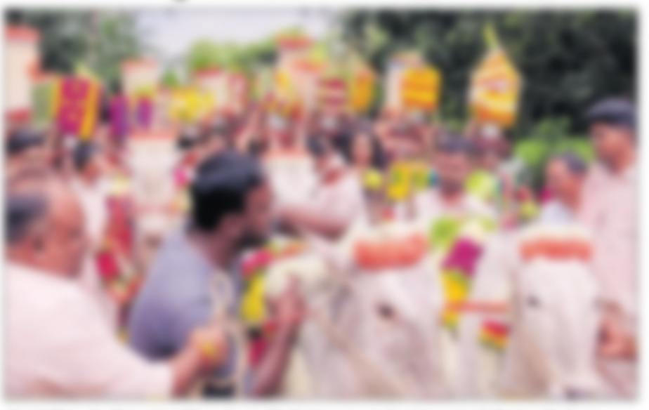
ದೇವಾಲಯದ ಘಟಕ ದಂಡು

ಮೈಸೂರು-ಬೆಂಗಳೂರು ರಸ್ತೆ ಬೆಂಗಳೂರಿನಿಂದ ಮೈಸೂರಿನ ಕಡೆಗೆ ಸಂಚರಿಸುತ್ತಿರುವ ಉತ್ತರ ಕರ್ನಾಟಕ ರಸ್ತೆ ಸಂಸ್ಥೆಯ ಬಸ್ಸುಗಳು ಸುಗಮವಾಗಿ ಸಂಚರಿಸುತ್ತಿವೆ. ರಸ್ತೆ ಸುಗಮವಾಗಿರುವುದರಿಂದ ಪ್ರಯಾಣಿಕರು ಸಂತೋಷಪಟ್ಟು ಸಂಚರಿಸುತ್ತಿದ್ದಾರೆ. ರಸ್ತೆ ಸುಗಮವಾಗಿರುವುದರಿಂದ ಪ್ರಯಾಣಿಕರು ಸಂತೋಷಪಟ್ಟು ಸಂಚರಿಸುತ್ತಿದ್ದಾರೆ.